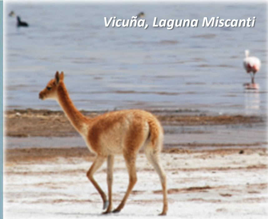
Vicuña, Laguna Miscanti