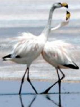
Flamenco de James