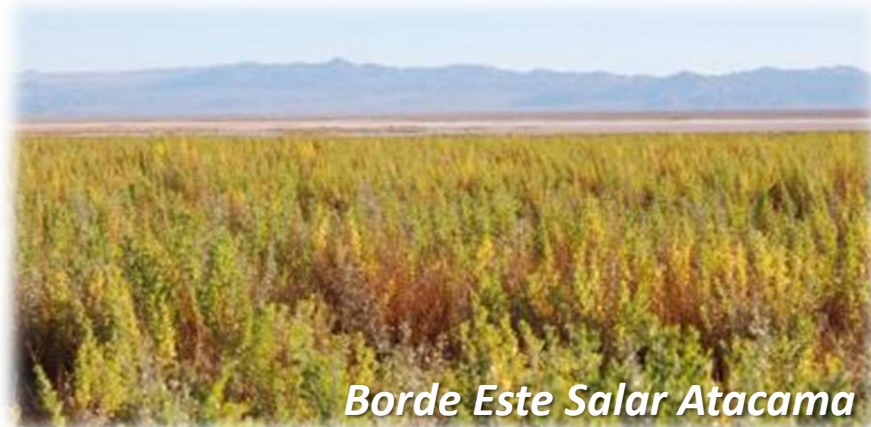
Borde Este Salar Atacama